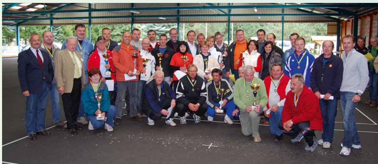
Alle waren Sieger!